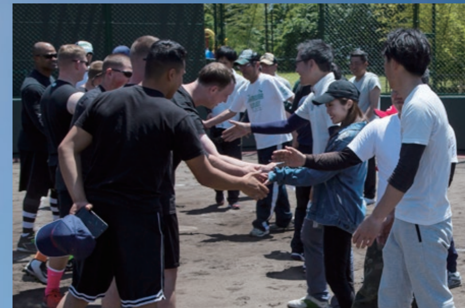
5月20日、愛宕スポーツコンプレックスで行われた親善ソフトボール大会で握手を交わす。基地隊員と日本人選手。U.S. service members and Japanese residents shake hands during a U.S.-Japan friendship softball tournament in Iwakuni City, Japan, May 20, 2018.