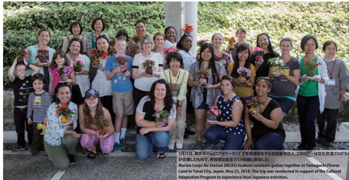
5月25日、柳井市の山口フラワーランドで写真撮影をする岩国基地住人。このツアーは文化交流プログラムが企画したもので、参加者は苔玉づくり体験に参加した。 Marine Corps Air Station (MCAS) Iwakuni residents gather together at Yamaguchi Flower Land in Yanai City, Japan, May 25, 2018. The trip was conducted in support of the Cultural Adaptation Program to experience local Japanese activities.