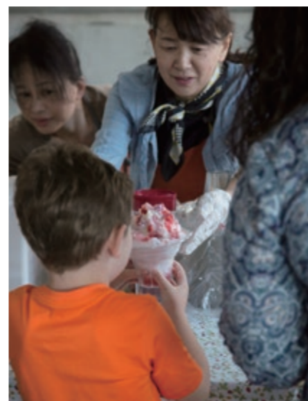
5月19日に岩国市卸売市場で行われたふれあい朝市でかき氷を買う基地住人。A Marine Corps Air Station (MCAS) Iwakuni resident receives a snow cone from a vendor at a wholesale market in Iwakuni City, Japan, May 19, 2018.