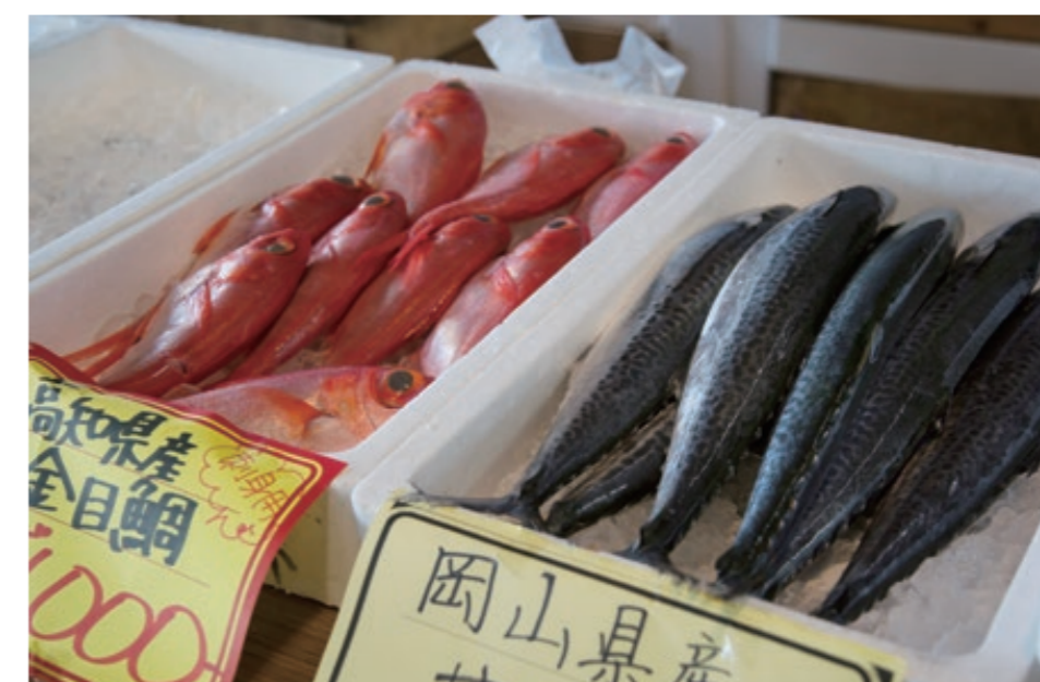
5月19日に岩国市卸売市場で行われたふれあい朝市では新鮮な魚も売られていた。Vendors display fish during a wholesale market in Iwakuni City, Japan, May 19, 2018.