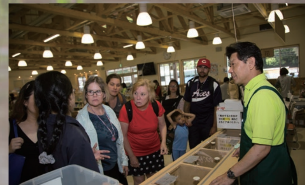
6月9日、田植え体験終了後、農産物直売所で説明を受ける基地住人。Marine Corps Air Station (MCAS) Iwakuni residents visit a farmers market in Iwakuni City, Japan, June 9, 2018.