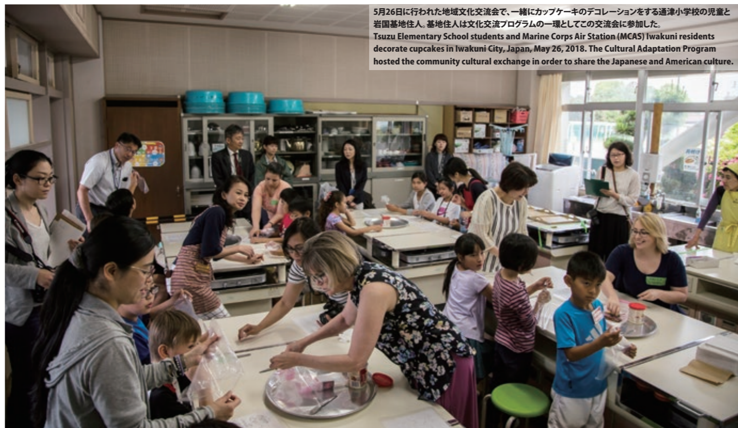
5月26日に行われた地域文化交流会で、一緒にカップケーキのデコレーションをする通津小学校の児童と岩国基地住人。基地住人は文化交流プログラムの一環としてこの交流会に参加した。 Tsuzu Elementary School students and Marine Corps Air Station (MCAS) Iwakuni residents decorate cupcakes in Iwakuni City, Japan, May 26, 2018. The Cultural Adaptation Program hosted the community cultural exchange in order to share the Japanese and American culture.