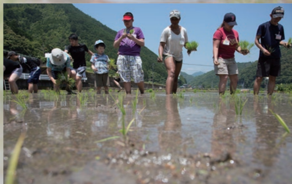
6月9日、横一列になって田植えをする岩国基地住人と地元住人の皆さん。Residents of Marine Corps Air Station (MCAS) Iwakuni and Iwakuni City plant rice in Iwakuni City, Japan, June 9, 2018.