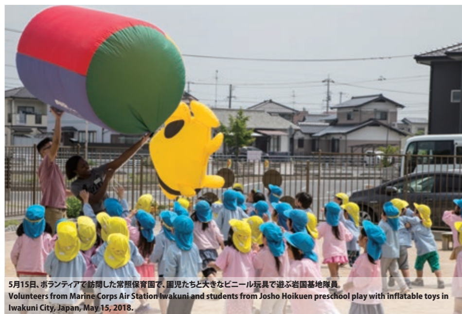
5月15日、ボランティアで訪問した常照保育園で、園児たちと大きなビニール玩具で遊ぶ岩国基地隊員。 Volunteers from Marine Corps Air Station Iwakuni and students from Josho Hoikuen preschool play with inflatable toys in Iwakuni City, Japan, May 15, 2018.