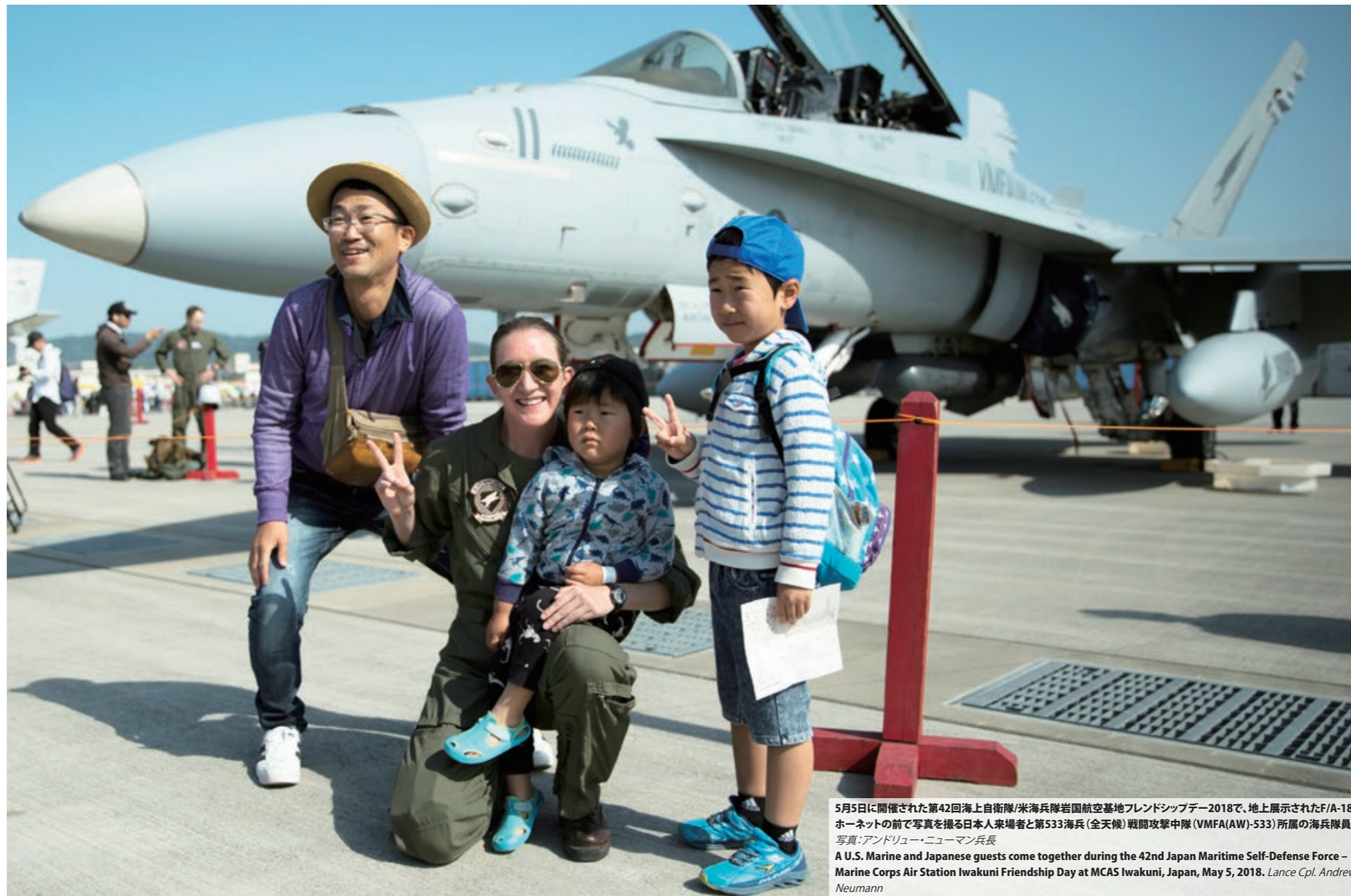
5月5日に開催された第42回海上自衛隊/米海兵隊岩国航空基地フレンドシップデー2018で、地上展示されたF/A-18ホーネットの前で写真を撮る日本人来場者と第533海兵(全天候)戦闘攻撃中隊(VMFA(AW)-533)所属の海兵隊員。 A U.S. Marine and Japanese guests come together during the 42nd Japan Maritime Self-Defense Force – Marine Corps Air Station Iwakuni Friendship Day at MCAS Iwakuni, Japan, May 5, 2018.