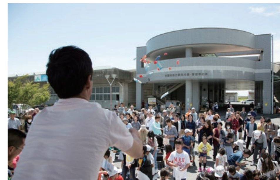
5月19日に岩国市卸売市場で行われたふれあい朝市で、来場者に向けて菓子を投げる朝市の主催者。A Japanese vendor throws candy into the crowd during an auction at a wholesale market in Iwakuni City, Japan, May 19, 2018.