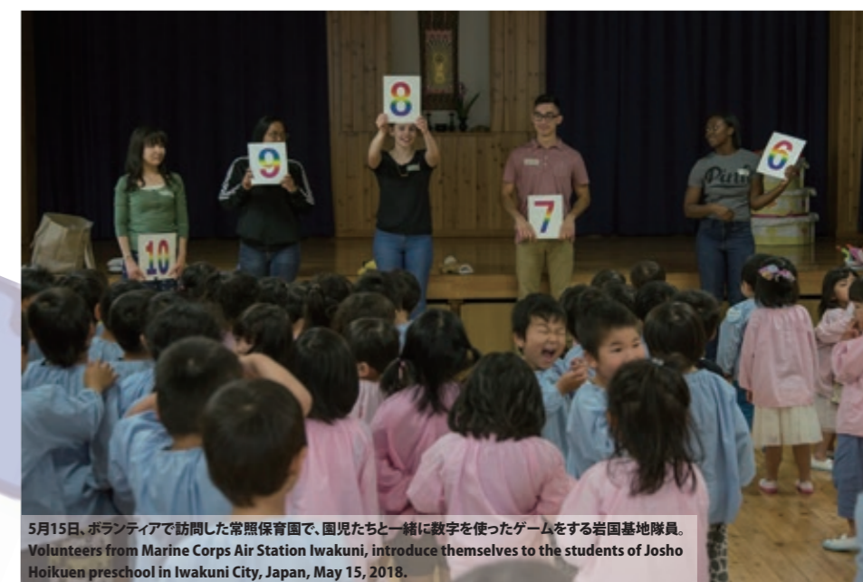
5月15日、ボランティアで訪問した常照保育園で、園児たちと一緒に数字を使ったゲームをする岩国基地隊員。 Volunteers from Marine Corps Air Station Iwakuni, introduce themselves to the students of Josho Hoikuen preschool in Iwakuni City, Japan, May 15, 2018.