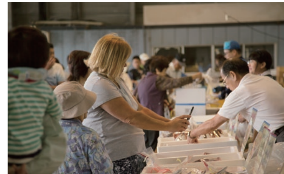
5月19日に岩国市卸売市場で行われたふれあい朝市で写真を撮る基地住人。A Marine Corps Air Station (MCAS) Iwakuni resident takes a photo at a wholesale market in Iwakuni City, Japan, May 19, 2018.