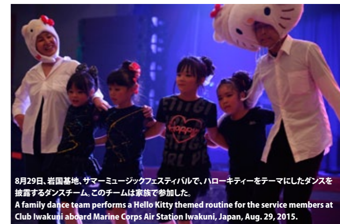
8月29日、岩国基地、サマーミュージックフェスティバルで、ハローキティをテーマにしたダンスを披露するダンスチーム。このチームは家族で参加した。A family dance team performs a Hello Kitty themed routine for the service members at Club Iwakuni aboard Marine Corps Air Station Iwakuni, Japan, Aug. 29, 2015.