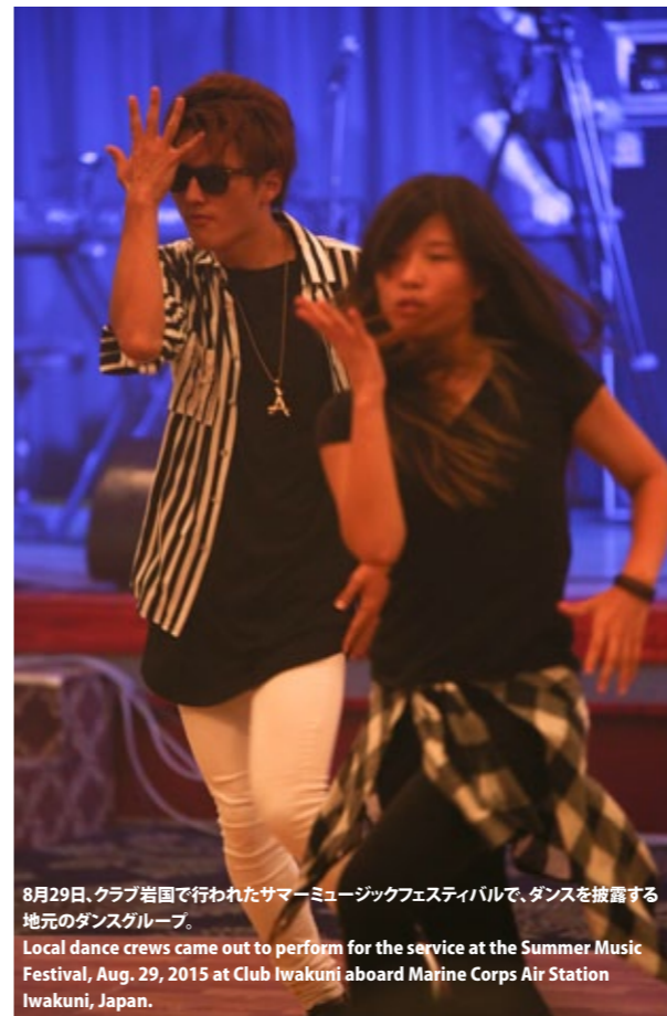
8月29日、クラブ岩国で行われたサマーミュージックフェスティバルで、ダンスを披露する地元のダンスグループ。Local dance crews came out to perform for the service at the Summer Music Festival, Aug. 29, 2015 at Club Iwakuni aboard Marine Corps Air Station Iwakuni, Japan.