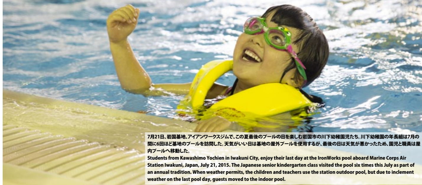
7月21日、岩国基地、アイアンワークスジムで、この夏最後のプールの日を楽しむ岩国市の川下幼稚園児たち。川下幼稚園の年長組は7月の間に6回ほど基地のプールを訪問した。天気の良い日は基地の屋外プールを使用するが、最後の日は天気が悪かったため、園児と職員は屋内プールへ移動した。 Students from Kawashimo Yochien in Iwakuni City, enjoy their last day at the IronWorks pool aboard Marine Corps Air Station Iwakuni, Japan, July 21, 2015. The Japanese senior kindergarten class visited the pool six times this July as part of an annual tradition. When weather permits, the children and teachers use the station outdoor pool, but due to inclement weather on the last pool day, guests moved to the indoor pool.