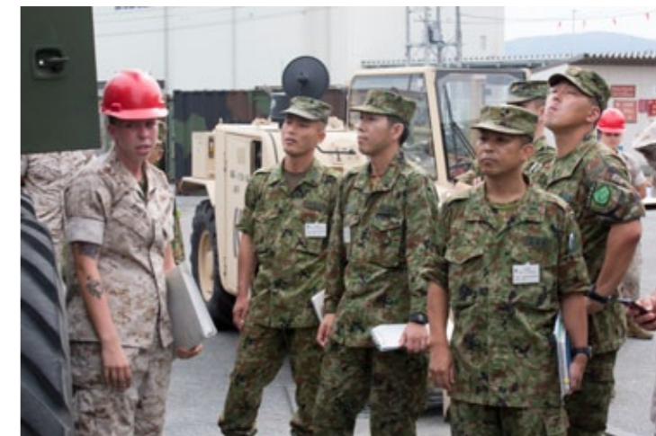
9月15日、岩国基地内での英語研修で、海兵第171航空支援師団中隊 (MWSS-171) で様々な重機を見学する陸上自衛隊員。英語研修では英語学習だけでなく、基地全体の機能についても学習した。Members of the Japan Ground Self-Defense Force learn about various heavy equipment vehicles during a tour of Marine Wing Support Squadron 171 at Marine Corps Air Station Iwakuni, Japan, Sept. 15, 2015. The English seminar was not just about learning English, but also learning the capabilities of the air station as a whole.