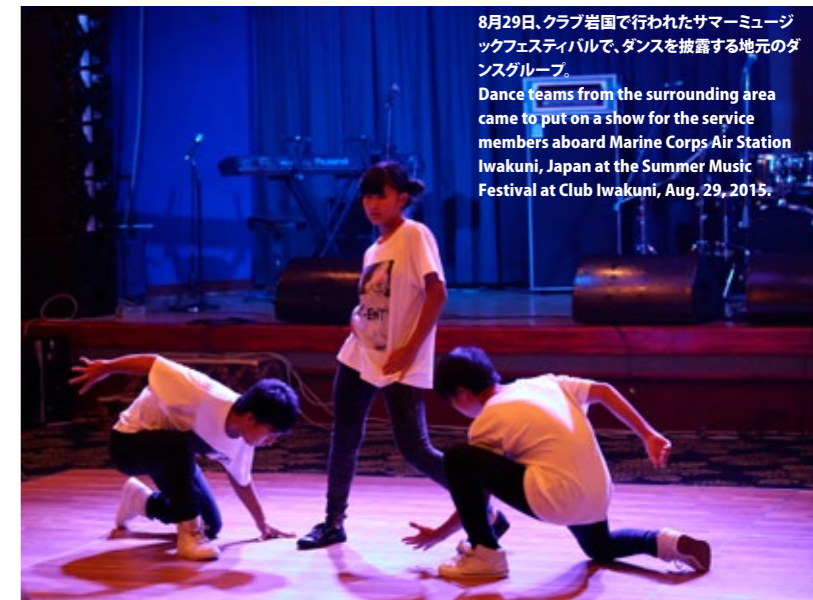
8月29日、クラブ岩国で行われたサマーミュージックフェスティバルで、ダンスを披露する地元のダンスグループ。Dance teams from the surrounding area came to put on a show for the service members aboard Marine Corps Air Station Iwakuni, Japan at the Summer Music Festival at Club Iwakuni, Aug. 29, 2015.