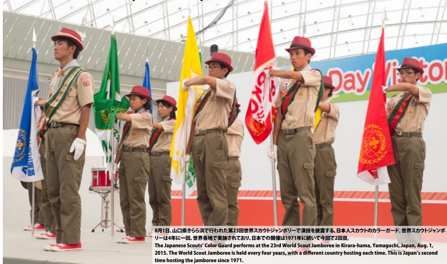
8月1日、山口県きらら浜で行われた第23回世界スカウトジャンボリーで演技を披露する、日本人スカウトのカラーガード。世界スカウトジャンボリーは4年に一回、世界各地で実施されており、日本での開催は1971年に続いて今回で2回目。 The Japanese Scouts' Color Guard performs at the 23rd World Scout Jamboree in Kirara-hama, Yamaguchi, Japan, Aug. 1, 2015. The World Scout Jamboree is held every four years, with a different country hosting each time. This is Japan's second time hosting the jamboree since 1971.