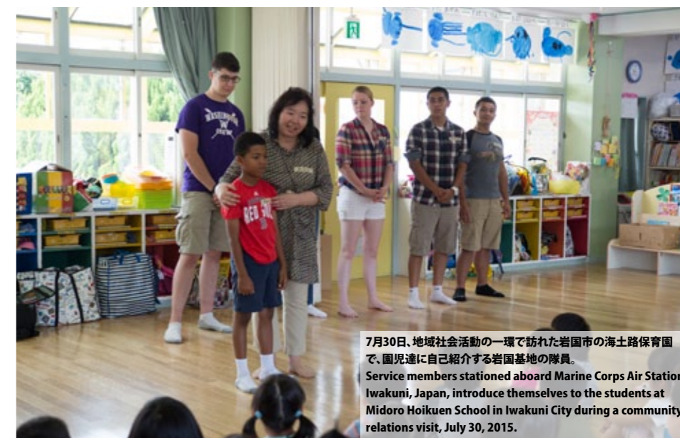
7月30日、地域社会活動の一環で訪れた岩国市の海士路保育園で、園児達に自己紹介する岩国基地の隊員。Service members stationed aboard Marine Corps Air Station Iwakuni, Japan, introduce themselves to the students at Midoro Hoikuen School in Iwakuni City during a community relations visit, July 30, 2015.