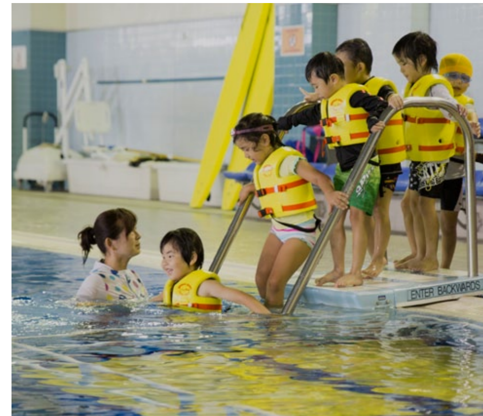
7月21日、アイアンワークスジムの屋内プールで、この夏最後のプール日を楽しむ岩国市の川下幼稚園児たち。基地プールを訪問することは、年長組の園児だけに与えられた特権で30年続く伝統である。 Students from Kawashimo Yochien in Iwakuni City, enjoy their last day at the IronWorks pool aboard Marine Corps Air Station Iwakuni, Japan, July 21, 2015. Coming to the station pool is an honor unique to the senior kindergarten class and is a 30-year tradition.