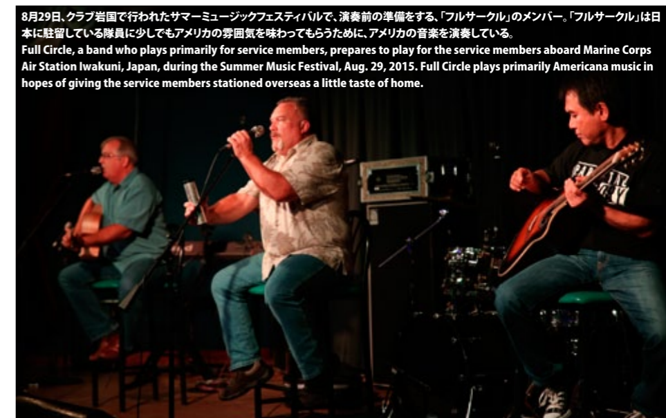
8月29日、クラブ岩国で行われたサマーミュージックフェスティバルで、演奏前の準備をする、「フルサークル」のメンバー。「フルサークル」は日本に駐留している隊員に少しでもアメリカの雰囲気を感じてもらうために、アメリカの音楽を演奏している。Full Circle, a band who plays primarily for service members, prepares to play for the service members aboard Marine Corps Air Station Iwakuni, Japan, during the Summer Music Festival, Aug. 29, 2015. Full Circle plays primarily Americana music in hopes of giving the service members stationed overseas a little taste of home.