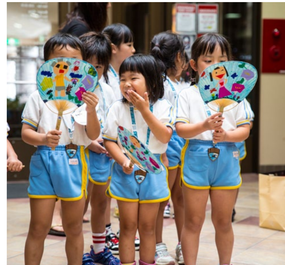
7月21日、この夏最後の基地内プール日をお祝いするために催されたクロスロードフードコートでの昼食会で、団扇(うちわ)をプレゼントしようと並ぶ川下幼稚園年長組の園児。プールで楽しい時間を過ごすために尽力してくれた特別なスタッフとゲストに感謝の気持ちを表すために、年長組の園児は自分達がプールで遊んだときの写真を貼り付けた団扇にリボンをつけて、プレゼントした。 Students from Kawashimo Yochien in Iwakuni City, celebrate their last day at the IronWorks pool aboard Marine Corps Air Station Iwakuni, Japan, July 21, 2015. To commemorate the last day at the pool, Kawashimo Yochien staff hosted a luncheon at the Crossroads food court. To show their thanks and gratitude, the kindergarten class decorated fans with photographs of their swimming adventures, made ribbons expressing thanks and presented them to the special staff and guests who made it possible for them to enjoy their time at the pool.